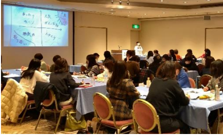
Aコース 研修のようす (写真中央：星山氏)